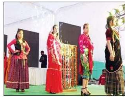
लोक संस्कृति को छटा दिखाने के लिए छात्रों ने प्रदर्शन किया।

उन्होंने विभिन्न पहलियों को एथलेटिक्स मीट के अवसर पर खुशी जताई। उन्होंने