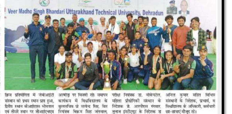
विभिन्न संस्थानों के छात्र-छात्राओं के साथ फोटो सत्र।