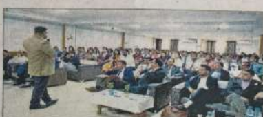
जेबीआईटी इंस्टीट्यूट में शनिवार को इंडस्ट्री मीट कार्यक्रम आयोजित किया गया। • सेनाकर्तु