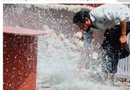
A man seeks relief from the heat by drinking water and splashing his face at a leaking water pipe on a hot day in Dehradun