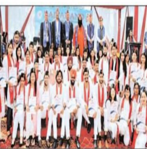
रामानंद इंस्टीट्यूट ऑफ फार्मेसी एंड मेनेजमेंट के दीक्षांत समारोह में सौ छात्रों को उपाधि मिली।