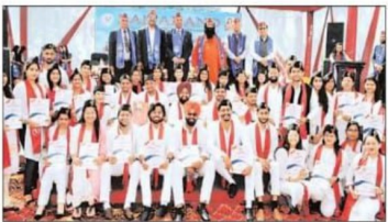
रामानंद इंस्टीट्यूट ऑफ फार्मेसी एंड मेनेजमेंट के दीक्षांत समारोह में सौ छात्रों को उपाधि मिली।