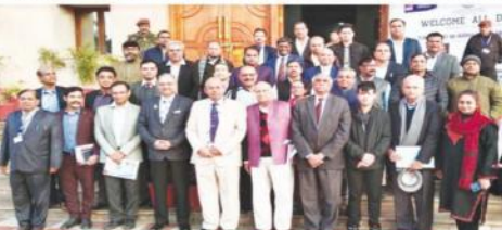
उत्तराखंड सरकार द्वारा 27 जनवरी को 18वां स्थापना दिवस मनाया जाएगा। समारोह में बतौर मुख्य अतिथि मुख्यमंत्री पुष्कर सिंह धामी एवं तकनीकी शिक्षा मंत्री सुबोध उनियाल शिरकत करेंगे।