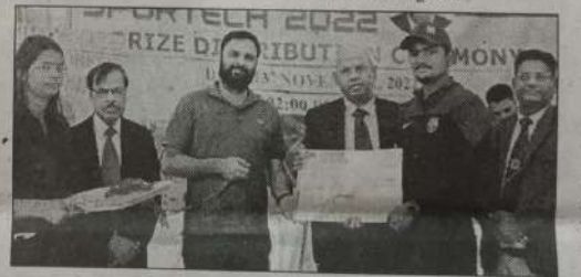
रुड़की। विजेता खिलाड़ी को सम्मानित करते मुख्य अतिथि।