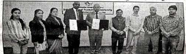
समझौता ज्ञापन पर हस्ताक्षर करने दौरान विवि व आईएसओ सदस्य।